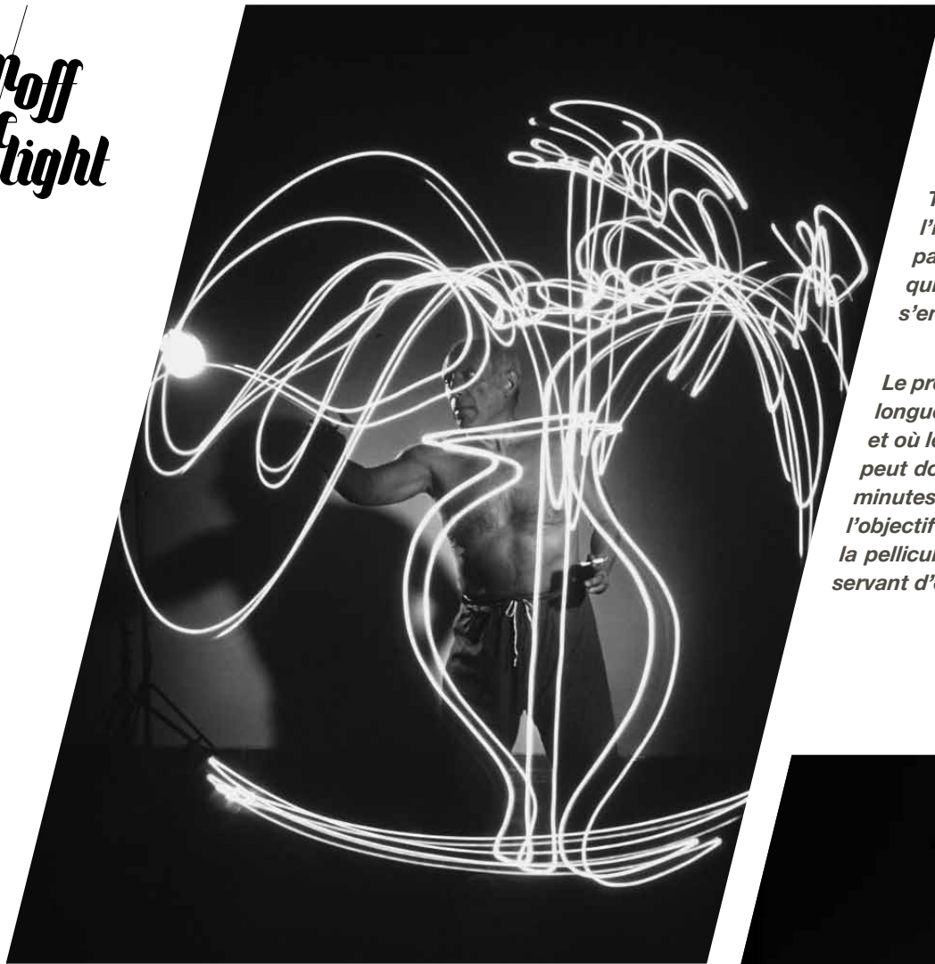
Pablo Picasso - 1946