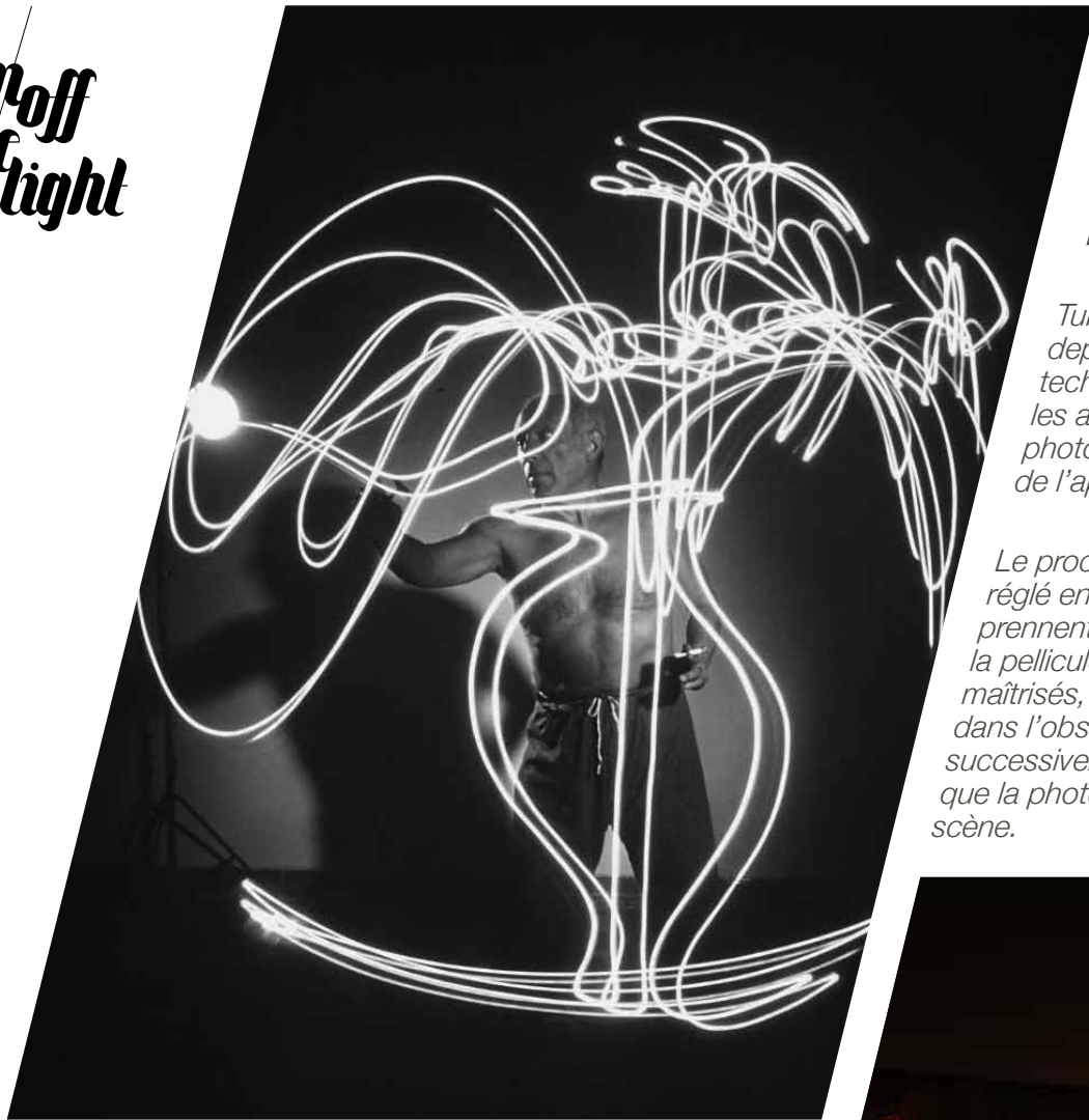
Pablo Picasso - 1946