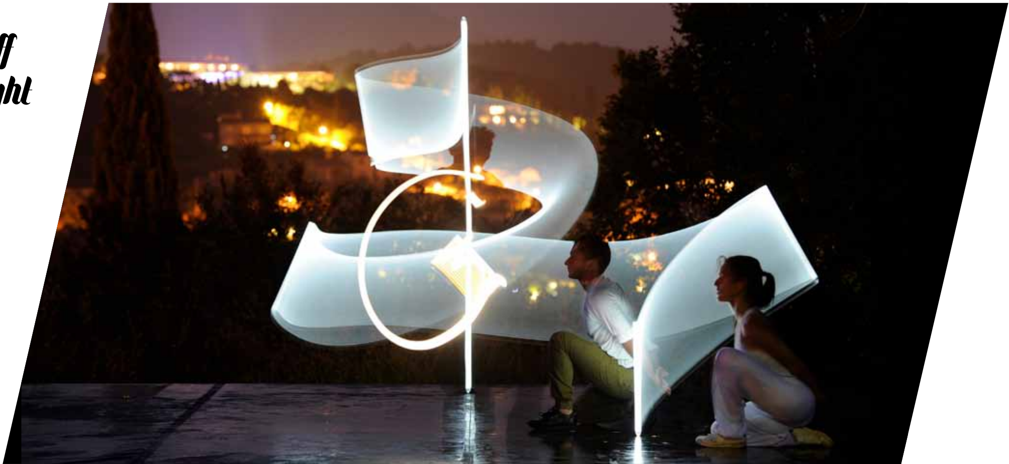
Photographie de la performance réalisée en live, en extérieur, lors du festival de calligraphie de Mougins